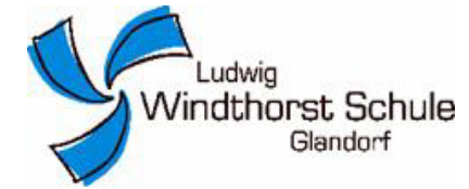
SchulabgängerInnen - Ergebnis 2015