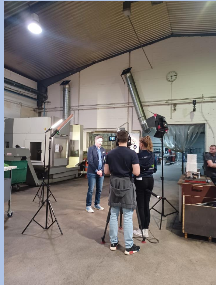
Hier entsteht ein Film (ProIT)